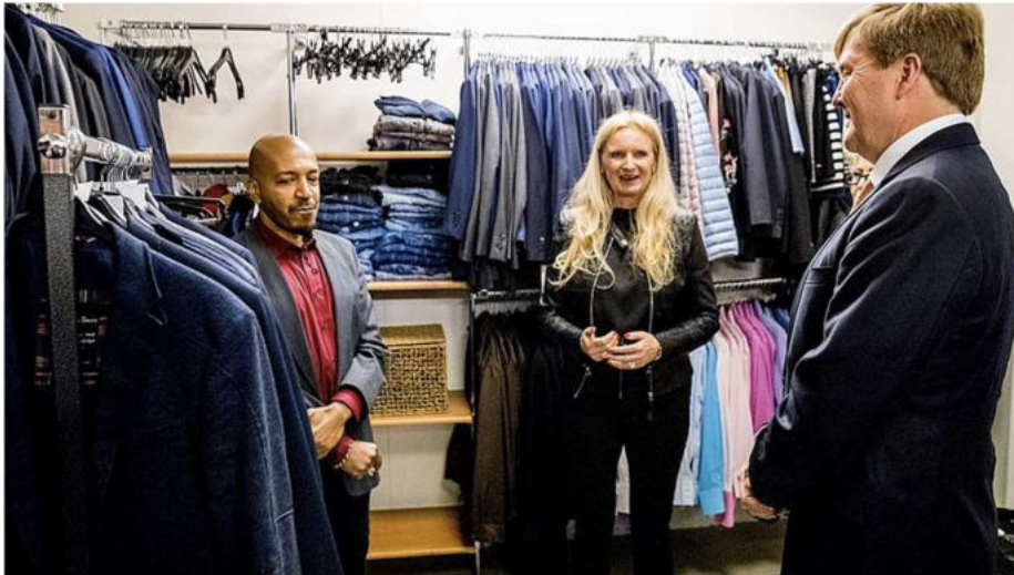
Bezoek aan de winkel in Amsterdam door Koning Willem Alexander