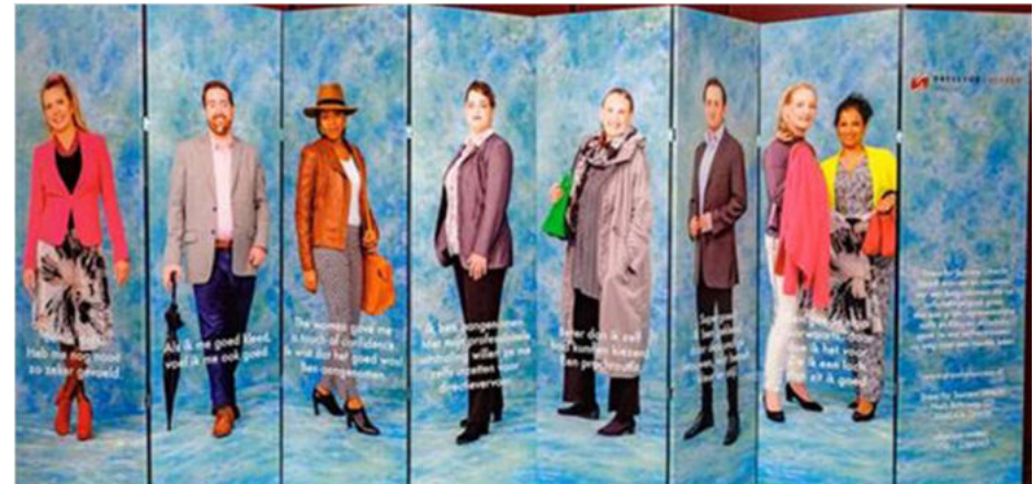
Tweede lustrum van de winkel in Utrecht met een reizende tentoonstelling

Het aantal kleedsessies groeit t.o.v. 2017 met 9% naar 2380. Groeiers zijn vooral de winkels in Leiden (61%), Utrecht (41%) en Leeuwarden (33%) en Gorinchem (23%). Bij andere winkels treden kleine dalingen op.